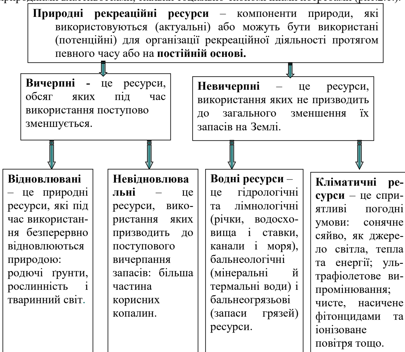
Рис. 2.1. Класифікація природних рекреаційних ресурсів за ступенем використання

Ступінь використання природних ресурсів визначається не стільки їх природними властивостями, скільки соціально-економічними потребами (рис.2.1.).