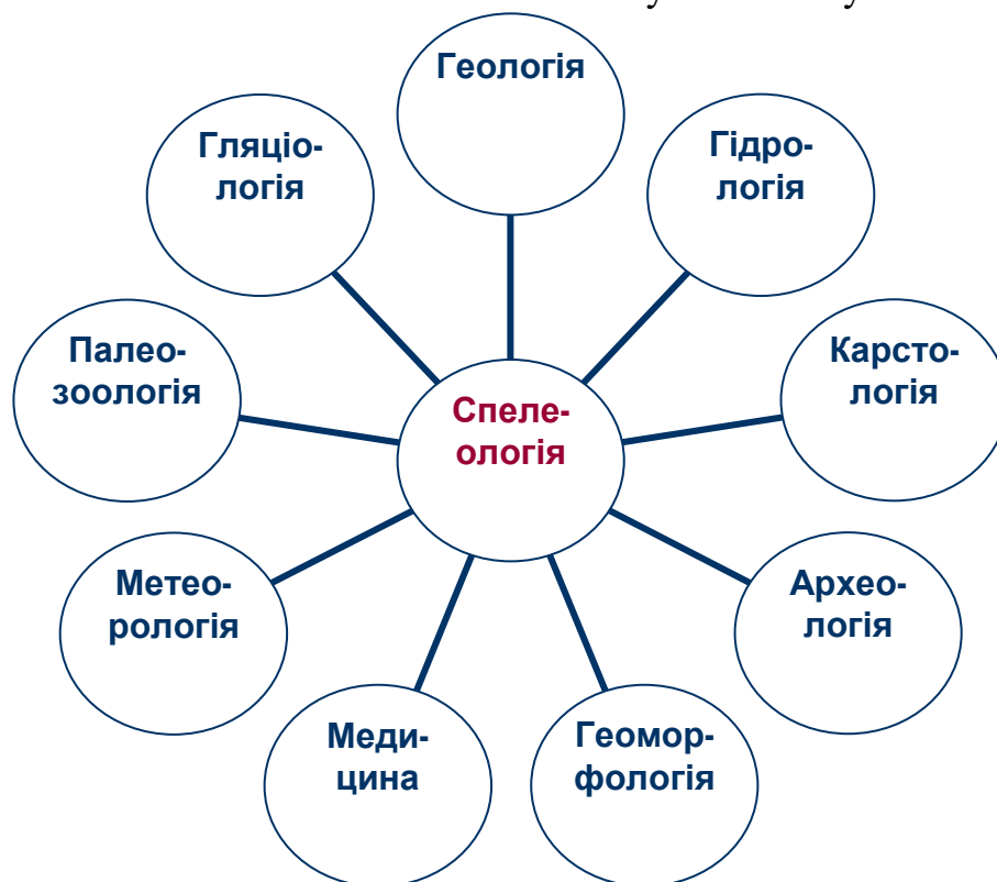
Рис. 7.1. Зв'язок спелеології з іншими науками

Спелеологія взаємопов'язана з іншими науками та науковими дисциплінами