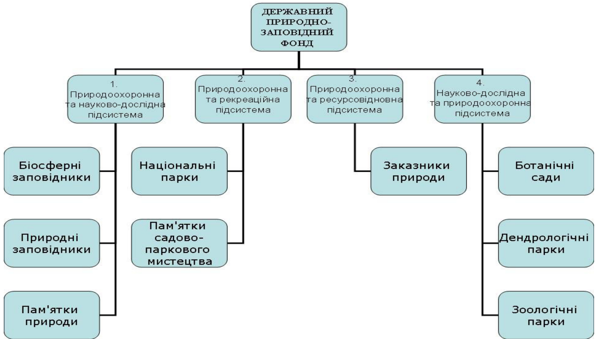
Рис.2.3. Структура Державного природно-заповідного фонду